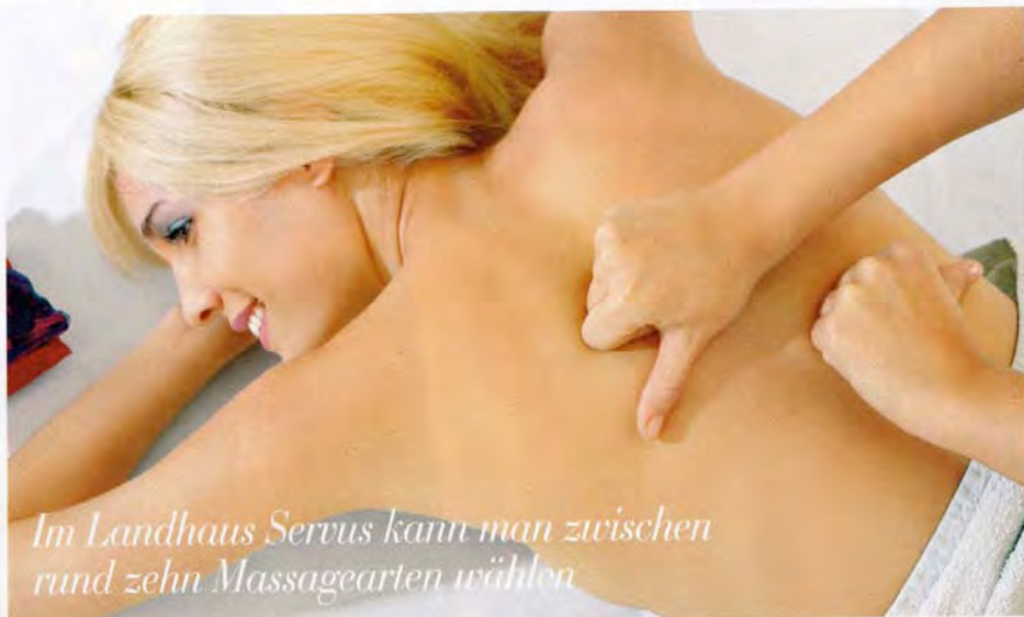
Im Landhaus Servus kann man zwischen rund zehn Massagearten wählen

sofort. Die Damenrunde war ein eingespieltes Team. Entspannt, mit Charme, Humor und gutem Schmäh. Kennengelernt haben sie sich fast alle vor einigen Jahren im Landhaus Servus. Manche kommen seit über zehn Jahren einmal oder sogar zweimal im Jahr – „so oft es geht“ – hierher, um sich verwöhnen zu lassen. Sie haben uns sofort „integriert“. Und das ist auch eine Besonderheit. Man wird hier nicht nur rundum verwöhnt, man findet, wenn man möchte, auch Freundinnen. Fazit: Wir kommen wieder, unbedingt!