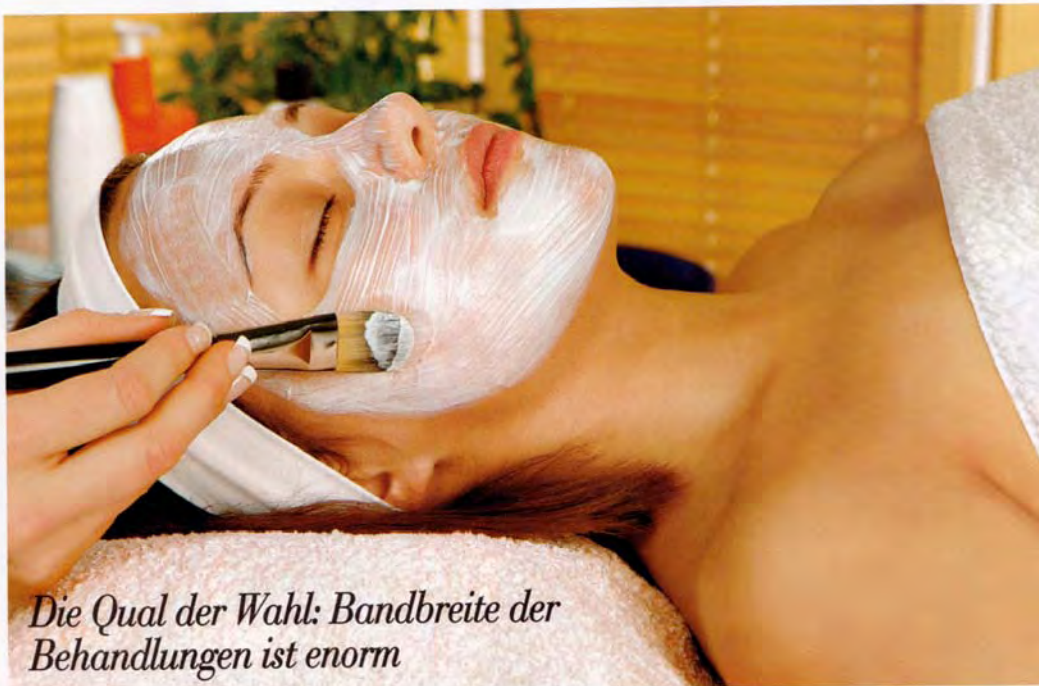
Die Qual der Wahl: Bandbreite der Behandlungen ist enorm

Wie in klassischen Beautyfarmen üblich verbringt man diese Regenerationswoche für Schönheitspflege und Gesundheit gern in weiblicher Gesellschaft. Das heißt Ladys only – und zwar maximal elf pro Woche, was von