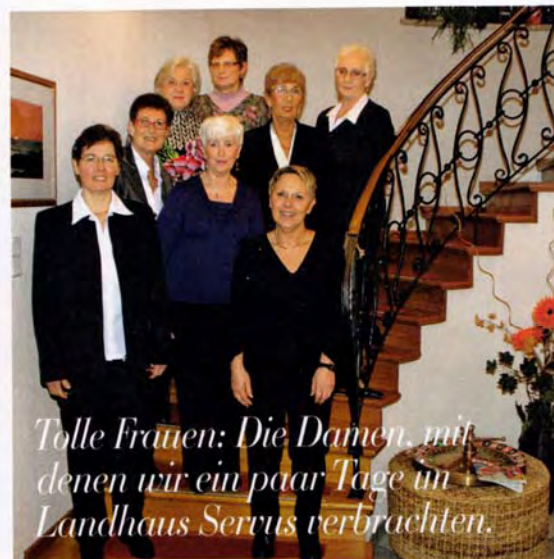
Tolle Frauen: Die Damen, mit denen wir ein paar Tage im Landhaus Serrus verbrachten.